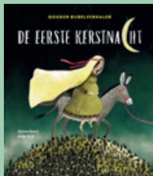
De eerste kerstnacht ISBN 9789047674139