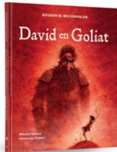
David en Goliat ISBN 9789047674108