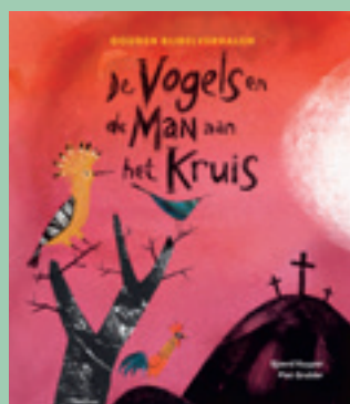
De vogels en de man aan het kruis ISBN 9789047674160