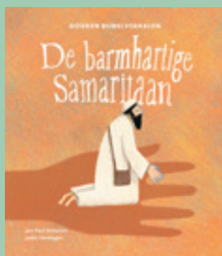
De barmhartige Samaritaan ISBN 9789047674146