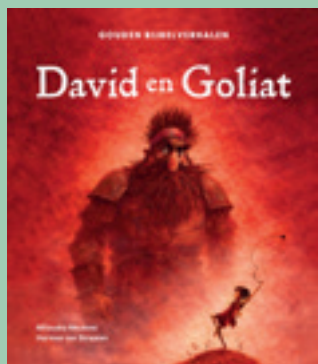
David en Goliath ISBN 9789047674108