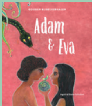
Adam en Eva ISBN 9789047674115