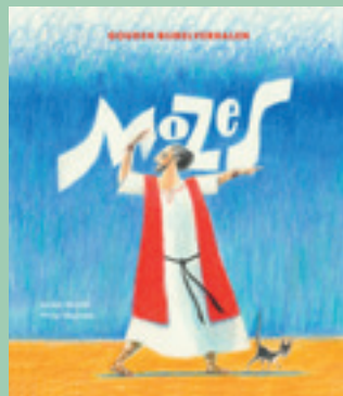
Mozes ISBN 9789047674214