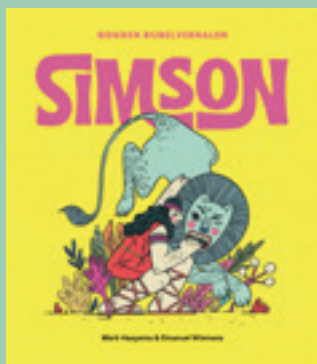
Simson ISBN 9789047674177