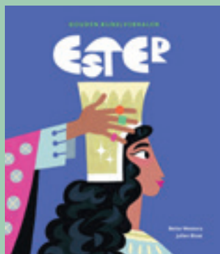
Ester ISBN 9789047674184