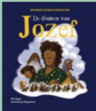
De dromen van Jozef ISBN 9789047674191