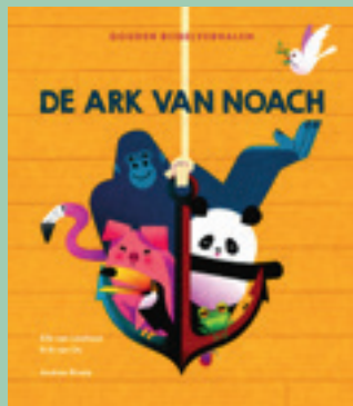
De ark van Noach ISBN 9789047674122