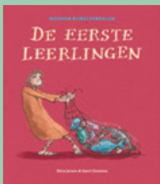
De eerste leerlingen ISBN 9789047674153