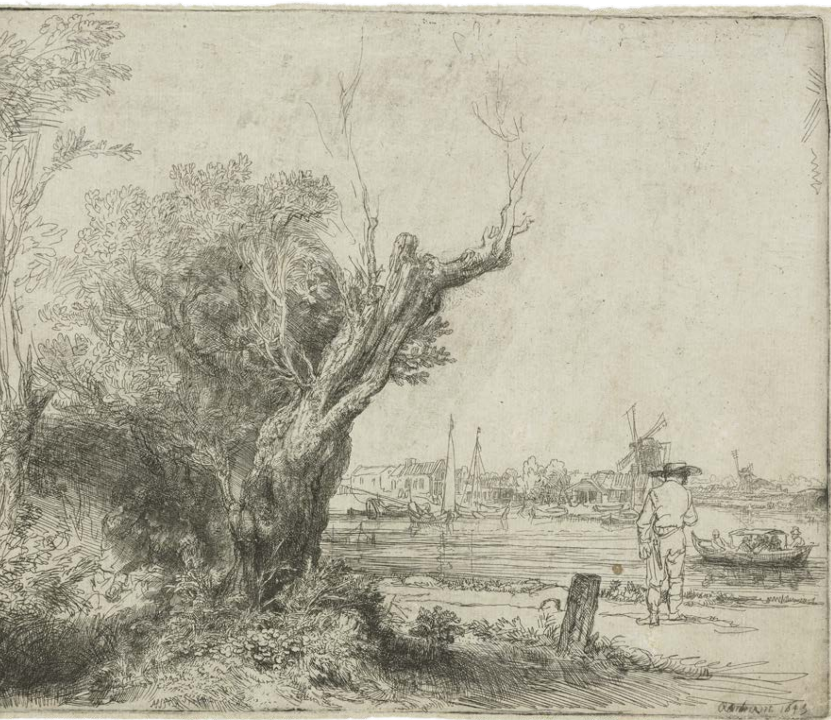
De Omval, 1645 Rembrandt