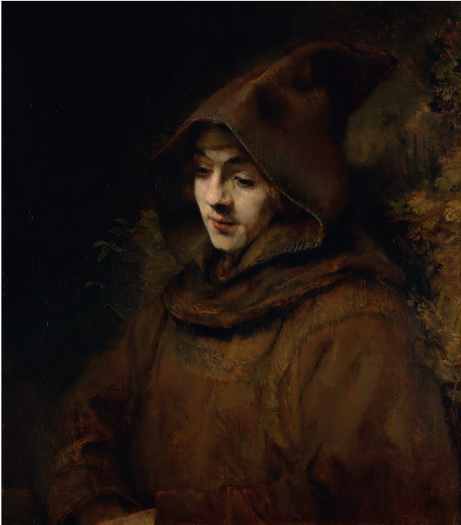
Rembrandts zoon Titus in monniksdracht, 1660